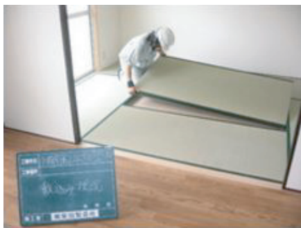
市営住宅の畳を敷き込んでいます。