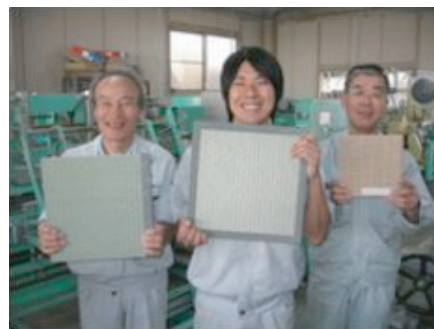
明るく！ 楽しく！ 喜んで！