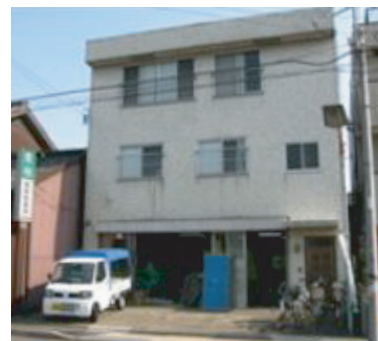
本社工場。バス通りに面しています。

仕事内容・その他： ◆畳、襖の重さ1枚当り約2～30kg、主に畳13kg、襖5kgです。 ◆運搬車はトラック(1.5t)バン、軽トラックです。◆配送範囲は主に愛知県内たまに岐阜、三重県があります。◆畳、襖の設置時簡単な調整作業があります。(カッターやドライバー等の工具)◆お客様との打合せ業務(仕事や納期の確認等)があります。◆社会保険完備 ◆作業服、携帯電話貸与 ◆交通費実費上限1万円まで